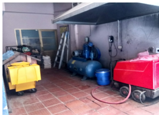
Foto No 2. Vista general del predio.