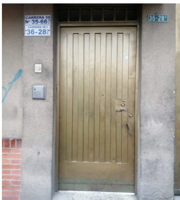
Foto No 1. Fachada del predio